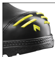
HAIX® High Durability Cap System