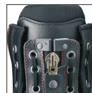
Systeme de lacage HAIX® Lacing